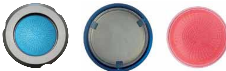
После отбора воздуха нужно чуть повернуть перфорированное сито и извлечь чашку Петри для последующей инкубации

Пробоотборник воздуха MAS-100 NT® имеет интегрированную автоматическую функцию калибровки. Она гарантирует точные, надежные, воспроизводимые результаты, исключает погрешности, причиной которых является человеческий фактор.