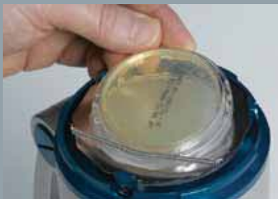
Держатель чашек 1.09214.0001 перфорированная крышка 1.09213.0001.