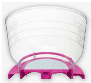
Конструкция воронки минимизирует количество остаточной жидкости и предотвращает прохождение образца мимо мембраны

Фильтрующие устройства EZ-Fit™ соответствуют международным стандартам (стандарты EP/USP/ISO) и удовлетворяют требованиям по проведению испытаний воды.