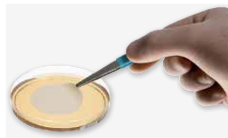
Дизайн системы слива гарантирует наилучшую форму мембраны, обеспечивающую идеальный контакт со средой и оптимальное извлечение микроорганизмов