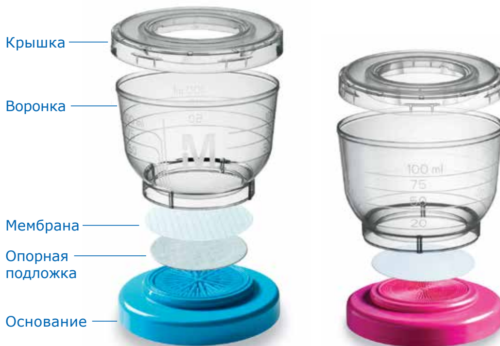
Компоненты фильтрационного устройства EZ-Fit™

Готовые к использованию фильтрационные устройства для определения числа микроорганизмов