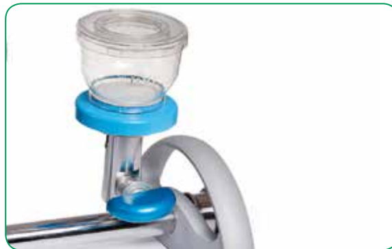
Устройство EZ-Fit™ идеально устанавливается на гребенку