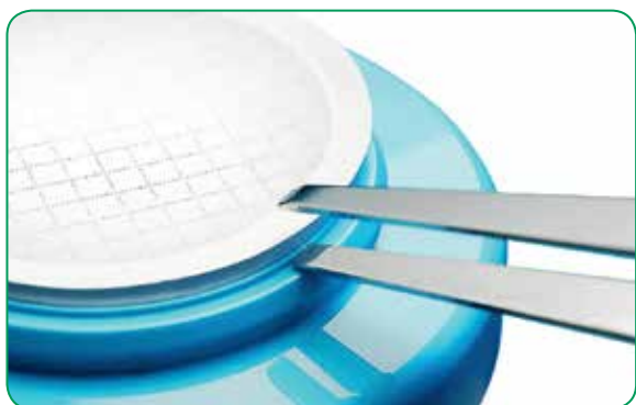
Ободок не дает пинцету вступить в контакт с фильтрующей областью мембраны

Фильтрующее устройство, которую Вы используете, должно помочь защитить Ваш образец от загрязнения во время испытания. Конструкция устройства EZ-Fit™ снижает риск случайного прикосновения пинцетом к фильтрующей области мембраны во время ее переноса и позволяет проводить фильтрацию при установленной крышке.