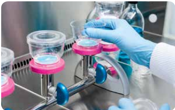
Удаление воронки одной рукой

Быстросъемные соединения для вакуумных шлангов и низкая высота гребенки делают стерильную фильтрацию более удобной, чем когда-либо. Особый адаптер к гребенке для фильтрационных устройств EZ-Fit™ позволяет удалять воронку одной рукой. Внутренняя часть гребенки EZ-Fit™ легко доступна для очистки, поэтому Вы можете быть уверены в том, что каждый процесс фильтрации является асептическим. Все компоненты можно удалить вручную и автоклавировать.