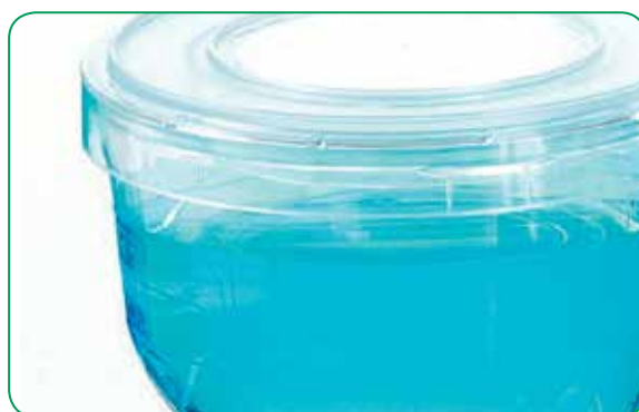
Вентилируемая крышка на устройстве во время фильтрации